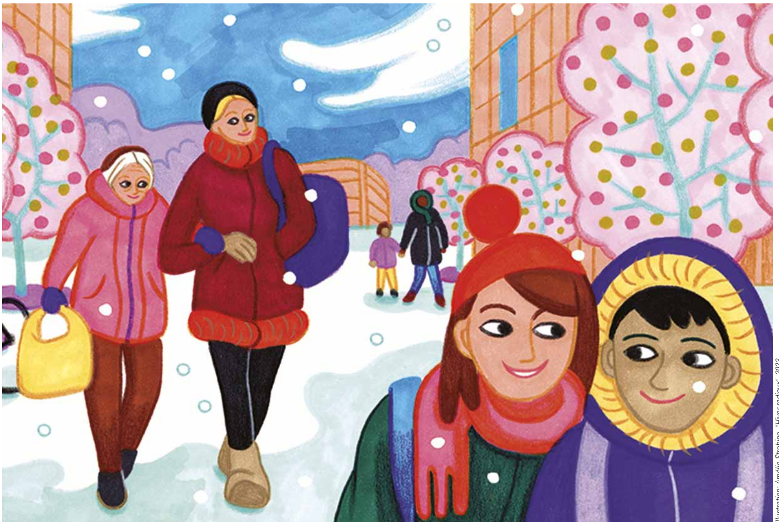
Illustration: Amélie Strobino, "Hiver radieux", 2023

La Ville de Lancy vous souhaite de bonnes fêtes de fin d'année et vous adresse ses meilleurs vœux pour l'année 2024. Les services de l'administration seront fermés du vendredi 22 décembre à 16h30 au lundi 1 er janvier inclus. Réouverture le mardi 2 janvier à 8h30. Pour plus d'informations sur les permanences durant cette période, rendez-vous sur www.lancy.ch .