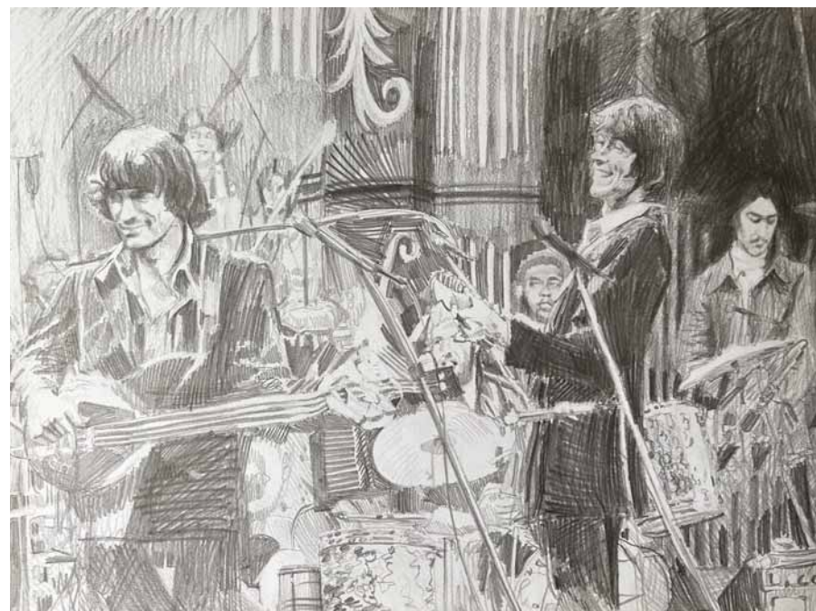
Caroline Tschumi, "The Band n°1", 2023, crayon gris sur papier