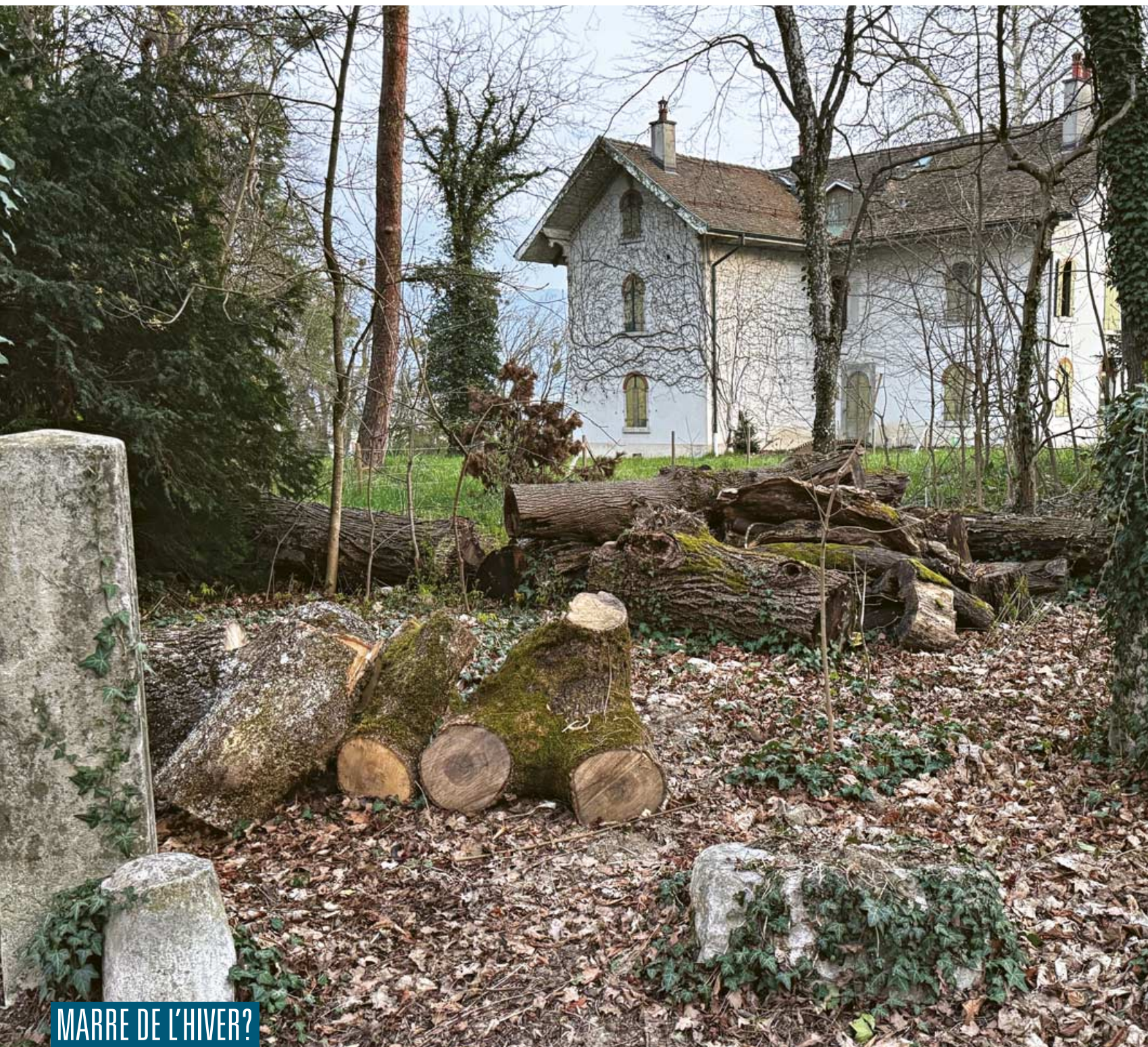
Parc Chuit (Petit-Lancy)