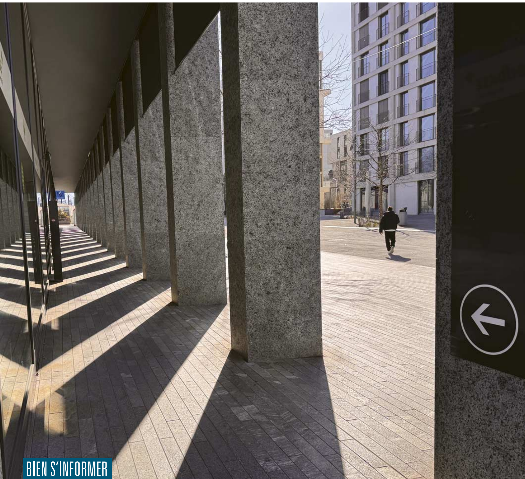
Place de Pont-Rouge