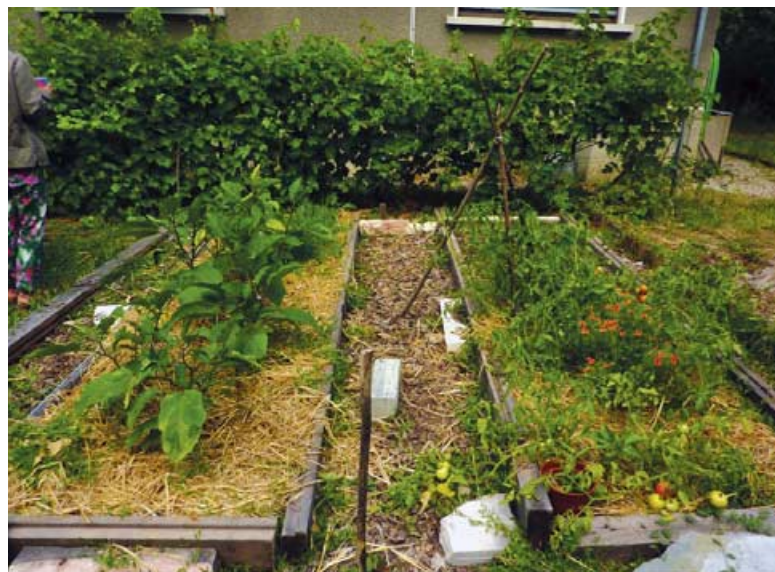
Planches du culture réalisées selon la méthode sans bêchage de Charles Dowding